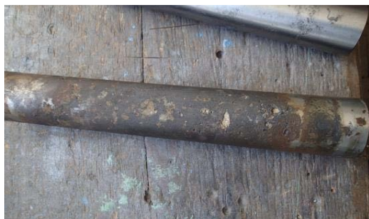
Abb.: Einblick in die durchgeführten Prüfarbeiten der SCOTECH GmbH